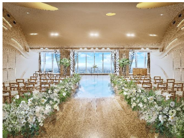
▲地上 200 メートル天空のチャペル「スカイホールそら」

エスクリは、ブランドメッセージ「All for Thank you(オールフォーサンキュー)」※2 のもと顧客満足度向上を目指し、衣裳、料理、写真など、婚礼に関する各アイテムを内製化することによってワンストップサービスを提供しております。『GRADATIONS (グラデーションズ)』でも、ブランドメッセージ「All for Thank you」のもと、新郎新婦とゲストの皆様にご満足いただけるサービスを提供してまいります。