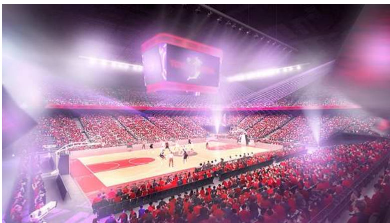
イメージパース（アリーナ内観）