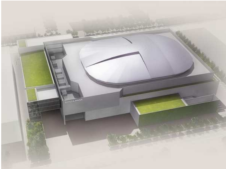
イメージパース（鳥瞰図）