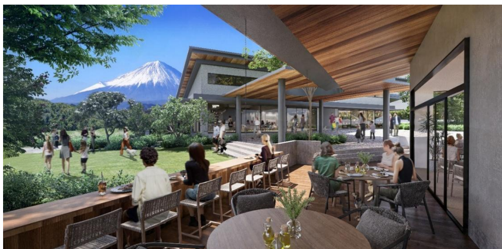
「富士モータースポーツフォレストテラス」イメージ

本施設は、2社が静岡県駿東郡小山町で協働して推進する再開発計画「富士モータースポーツフォレストプロジェクト」の一環として、トヨタ不動産が開発・運営します。「富士モータースポーツフォレスト」は、国際サーキット「富士スピードウェイ」を中心とした、モータースポーツや様々なモビリティ体験を楽しめる複合施設で、エリア全体が「新しい体験」や「発見」のある場所へと常に進化を続けています。