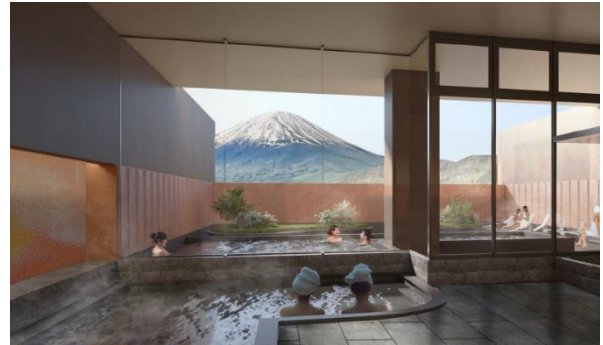
温泉施設イメージ

富士の眺めと一体化する温泉施設では、目の前に広がる富士山を背景に、天然温泉とサウナがお客様の心と体を癒します。