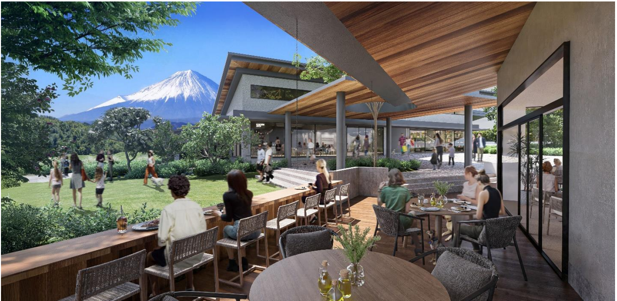
「(仮称) おおみかテラス」イメージ

「(仮称) おおみかテラス」は 2026 年春に一部のレストランが先行オープン、2027 年春に温泉施設・ホテル等も含め全面開業の予定です。