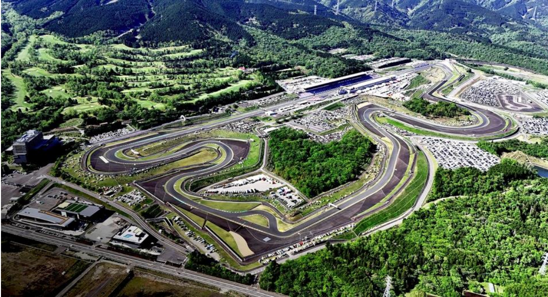
富士スピードウェイ (1966 年開業)