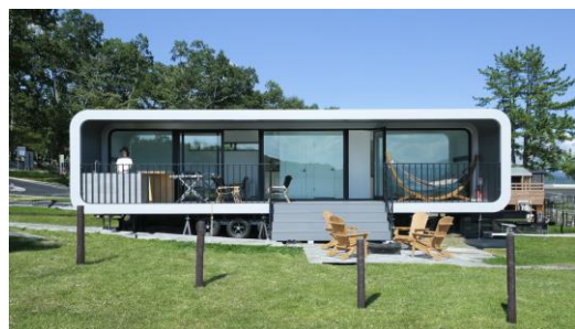
RECAMP 富士スピードウェイ (2024 年開業)