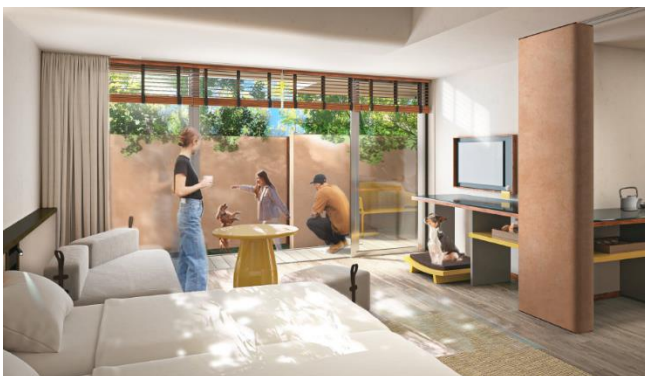
愛犬と泊まれる客室イメージ

また施設内には、富士山の麓から連なる緑豊かな森と開放的な広場空間、この地で育まれた地下水が流れるせせらぎを整備し、居心地の良い環境を創出。春には桜並木が行き交う人たちの目を楽しませます。