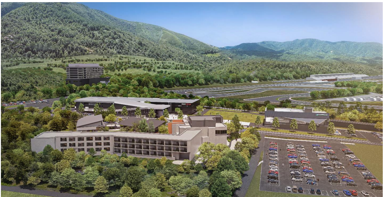
富士モータースポーツフォレスト全体イメージ

2022 年にはラグジュアリーな体験を提供する「富士スピードウェイホテル」と、時代を象徴するレーシングカーを展示する「富士モータースポーツミュージアム」がオープンしました。さらに、2023 年には「ルーキーレーシングガレージ」「ウェルカムセンター」「シェイドレーシング FUJI ファクトリー」、2024 年には「RECAMP 富士スピードウェイ」が開業し、エリア全体が「モビリティ体験の聖地」を目指して着実に発展を続けています。