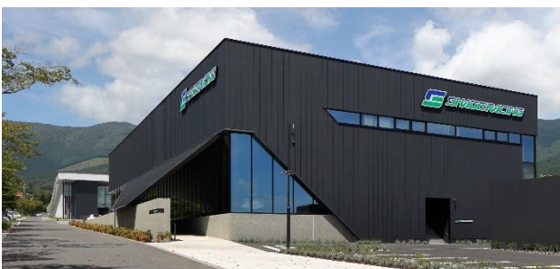
シェイドレーシング FUJI ファクトリー (2023 年開業)