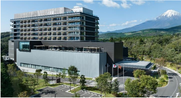
富士スピードウェイホテル (2022 年開業)