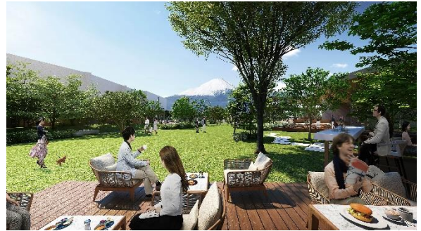
レストランのイメージ

和・洋・中の多彩な料理を提供するレストランなど、バラエティに富んだ 8 店舗が出店を予定しています。地元静岡の新鮮な食材を活かした料理をお楽しみいただけます。