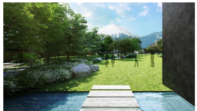
ランドスケープイメージ